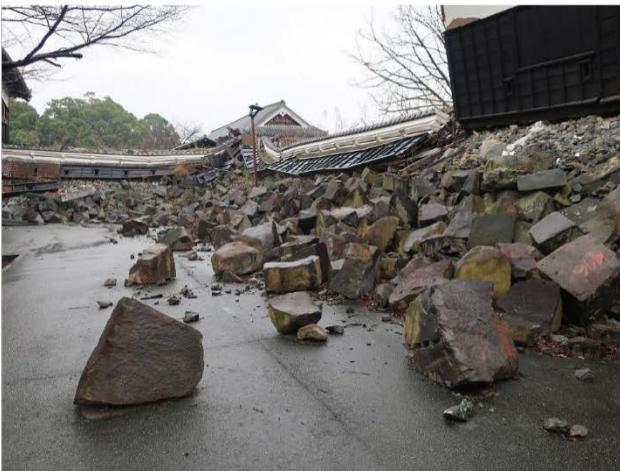
(熊本城元太鼓櫓の被害)

気象庁は熊本県を中心とする一連の地震活動について、「平成28年（2016年）熊本地震」と命名しました。