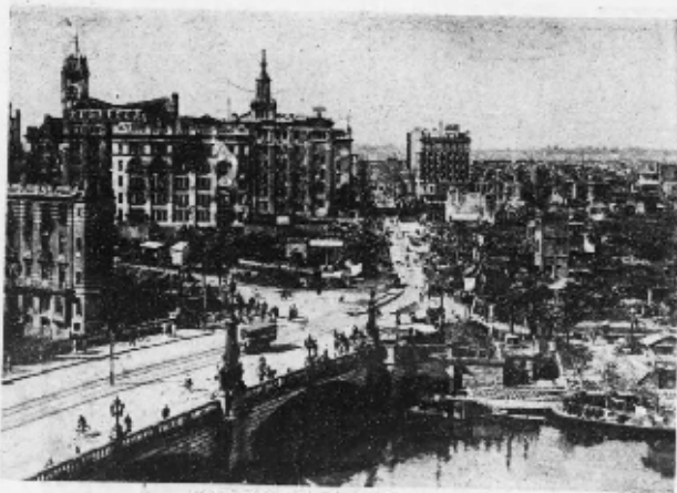
最光るた物振るむを面方新編見録二りよ橋本日

首都圏では関東大震災以前にも1703年元禄関東地震や1855年安政江戸地震、1894年明治東京地震の大地震が発生しています。