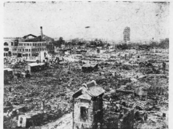
と階二十たれ崩しへにみ塵し化と原母娘の面一も尙其寫眞活図公卒送しめ極を並全もしの 最光るた物振るむを戦域の場劇開節