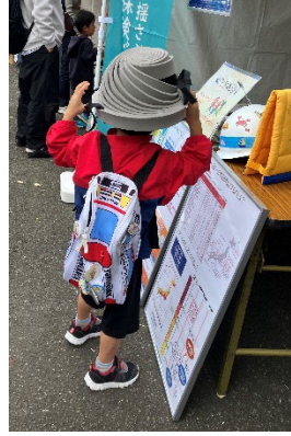
展示ヘルメットの装着体験