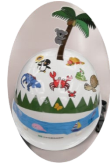
配布した防災ヘルメット用シールの活用例