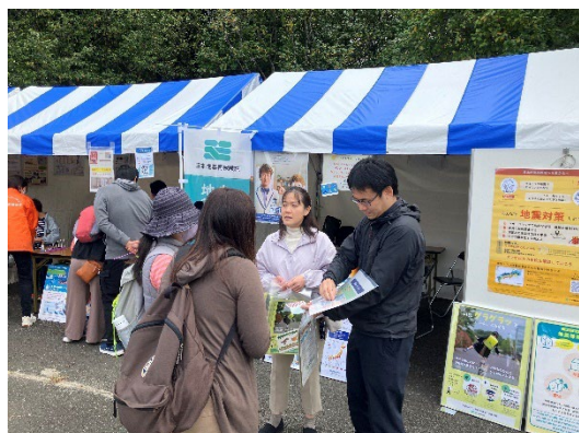
アンケートにご協力いただく様子

また、当日ブースにお立ち寄りいただいた方々に「地震保険への加入の有無」や「地震保険に加入していない理由」などのアンケートにご協力いただきましたが、地震保険に加入されている方々が大変多く、地域の皆様方の防災への意識の高さに感銘を受けました。