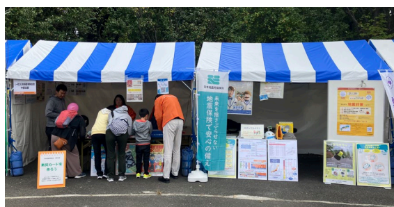
ブースの様子 (左)損保協会・(右)当社

損保協会中部支部のブースでは「写真入り防災カードの作成体験」、「地震こわれる診断VRによる地震発生時の建物の揺れの疑似体験」などを行い、当社ブースでは「ポスター掲示による地震保険の紹介」、「小さいお子様がいるご家庭向けの地震対策啓発チラシや防災ヘルメット用動物シールの配布」などを行いました。