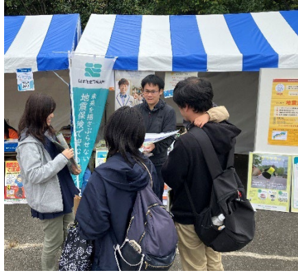
地震保険のご説明の様子